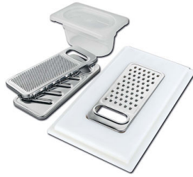
Kit rallador con soporte para anillo y bandeja de recogida de alimentos 8159 101 * sólo en combinación con el accesorio 8644 101